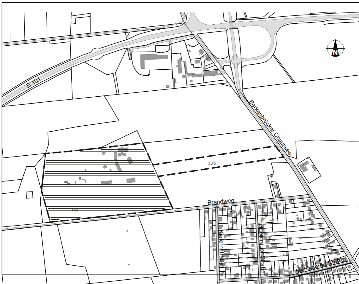
Übersichtsplan mit Kennzeichnung des Geltungsbereiches des Bebauungsplanes Nr. 51/2023 „Feuerwehrtechnisches Zentrum Teltow-Fläming“ (Strichlinie) und des Bereiches der Änderung des Flächennutzungsplanes Nr. 16/2023 "Feuerwehrtechnisches Zentrum Teltow-Fläming" (Schraffur)

Die Lage und Abgrenzung des Geltungsbereiches des Bebauungsplanes Nr. 51/2023 „Feuerwehrtechnisches Zentrum Teltow-Fläming“ ist der nachfolgenden Karte zu entnehmen. Der Bereich für die Änderung des Flächennutzungsplanes umfasst hingegen nur die Fläche der Gemarkung Frankenfelde, Flur 4, Flurstück 33/6.