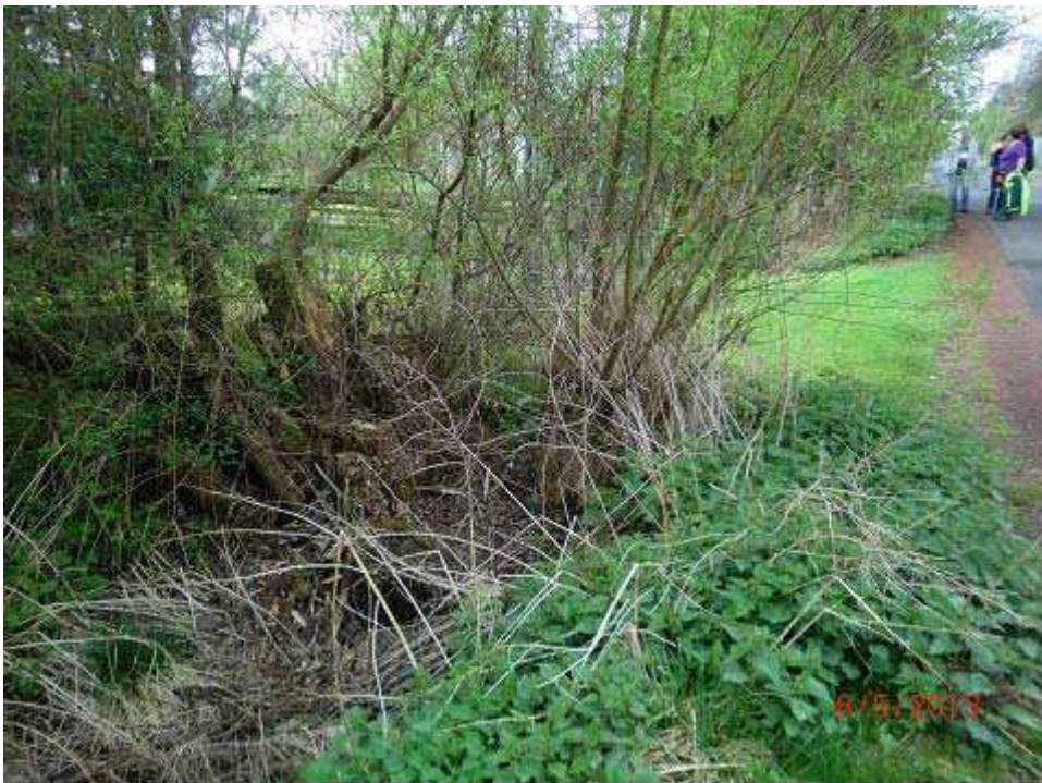
Bild 2: Reste des alten Mittelbuschgrabens in der Mittelbuschstraße

Im nächsten Schritt ist es erforderlich, die Genehmigungsfähigkeit herzustellen. Dazu ist es notwendig, eine Planungsunterlage herzustellen, nach der im Anschluss auch gebaut werden kann. Mit der Planungsunterlage werden die Untere Wasserbehörde und die Untere Naturschutzbehörde um Stellungnahme gebeten und eine wasserrechtliche Erlaubnis beantragt. Eine Baugenehmigung ist für diese Anlage nicht erforderlich. Die geschätzten Kosten für die Variante 1 betragen ca. 42.000 EUR