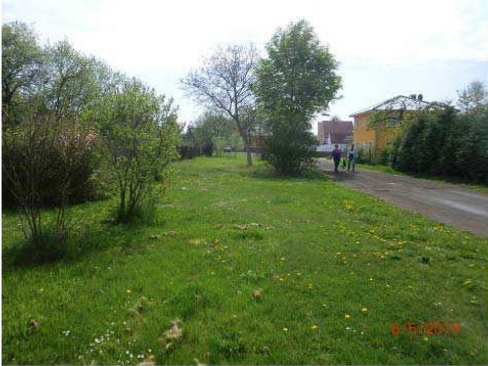
Bild 1: Bereich für geplante breite und flache Mulden nördlich An den Eichelstücken