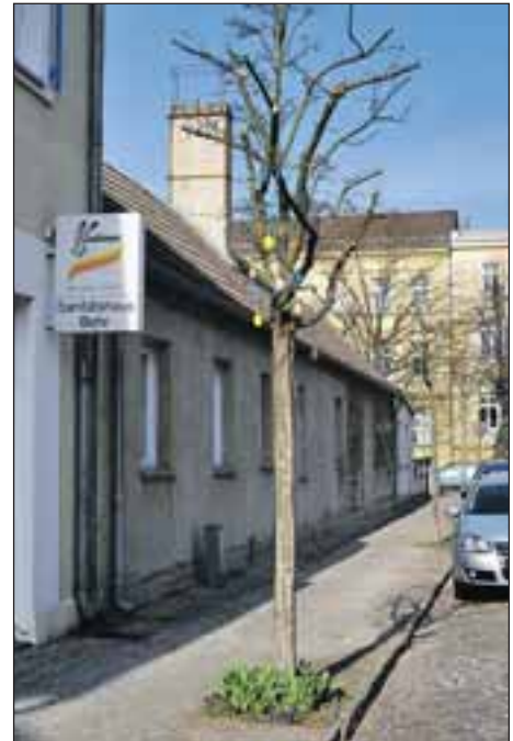
Gartenstraße: Sogar Baum dekoriert.