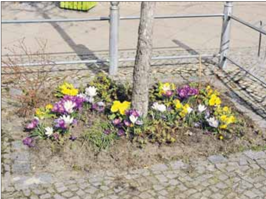
So schön wie hier in der Käthe-Kollwitz-Straße kann eine Baumscheibe aussehen.