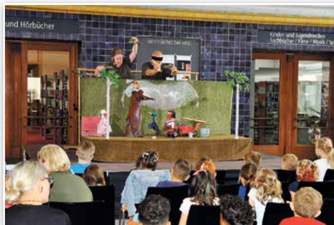
Das Lindenberger Marion-Etten-Theater zeigte das „Feuerwehrmärchen“.