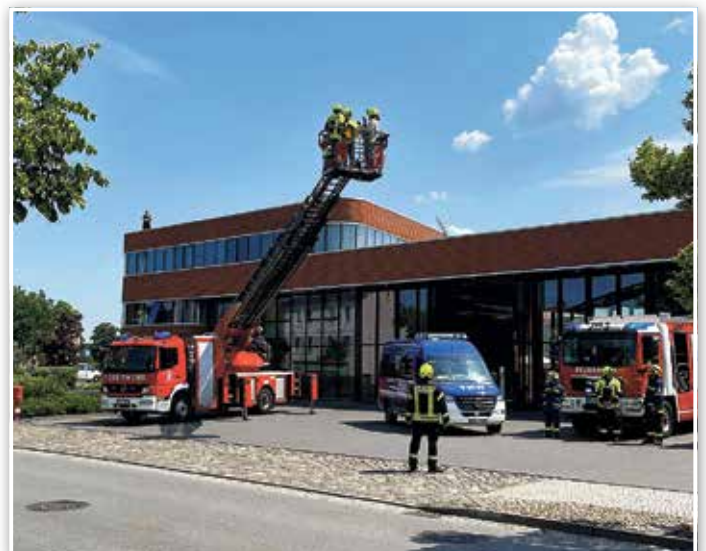
Beim Videodreh half auch die Feuerwehr fleißig mit.

Wir schicken herzliche Glückwünsche in das schöne Perleberg und freuen uns trotzdem über den schönen Film, der entstanden ist und auf youtube veröffentlicht wurde.