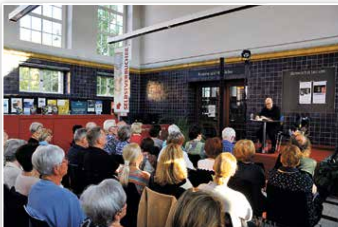
Der bekannte Schauspieler und Autor Christian Berkel las aus seinem Bestseller „Ada“.