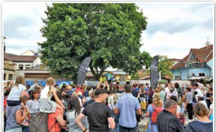
Zur Siegerehrung der Ministaffel versammeln sich viele stolze Väter, Mütter und Lehrer.