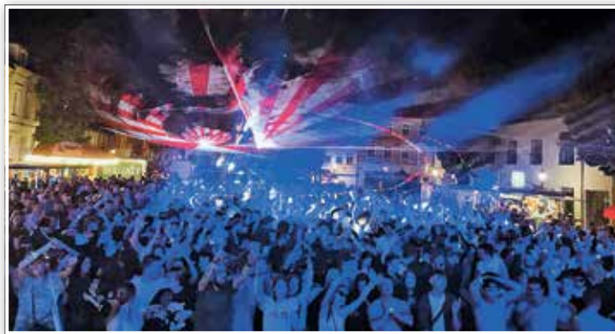
So viele Gäste wie noch nie feierten friedlich zusammen auf dem Marktplatz.