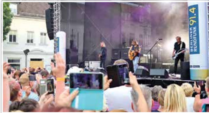
Die Kultband Münchener Freiheit begeistert Fans aus nah und fern.

bunt, anregend, heiter, voller Musik und Unterhaltung, mit sportlichen Akzenten und geistiger Nahrung, mit Nervenkitzel in den Fahrgeschäften, mit Speis und Trank in breiter Vielfalt und vor allem mit jeder Menge Gelegenheit, Wiedersehen und Wiedererkennen mit alten Freunden zu feiern und vielleicht auch, neue Freundschaften zu schließen.“