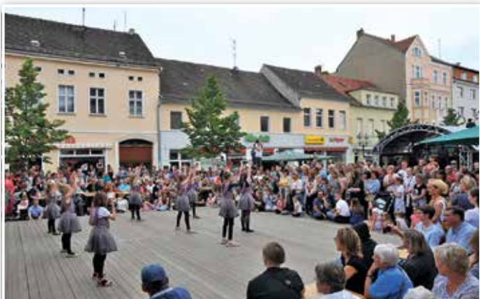
Tänzerinnen und Tänzer der Tanzschule Mierisch überzeugen das zahlreiche Publikum von ihrem Können.