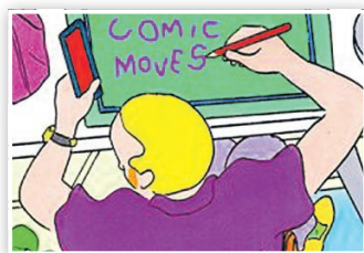
Comic-Moves @ Paul Paetzel

► 20.07. | 10:00 Uhr Live-Stream-Comic-Show – Ferienangebot