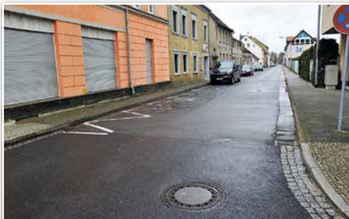
So sieht die Buchtstraße derzeit aus.

Bislang ist die Fahrbahn 5,90 m breit und links und rechts fügen sich schmale Gehwege an, die jedoch kaum wirklich nutzbar sind. Eine andere Variante wäre, einen Gehweg zu verbreitern. Auf der gegenüberliegenden Straßenseite gäbe es dann nur einen 75 cm breiten Sicherheitsstreifen bis zur Häuserkante. Würde man dagegen die Fahrbahn auf 5,50 m verkleinern, bliebe sogar Platz für einen 2,15 m breiten Gehweg, der auch mit Rollator oder Kinderwagen gut nutzbar wäre, und einen ein Meter breiten Sicherheitsstreifen gegenüber. Durch die auf der Straße parkenden Autos würde es aber dann zum Beispiel im Begegnungsfall Radfahrer und PKW recht eng auf der Fahrbahn werden. Die vierte Variante sieht vor, aus der Buchtstraße eine Einbahnstraße in Richtung Puschkinstraße zu machen. Lässt man dort dann aber den Radverkehr in beide Richtungen zu, ergeben sich neue Gefahrenpunkte. Außerdem erzeugen Einbahnstraßen generell mehr Verkehr, weil öfter um das Karree gefahren wird.