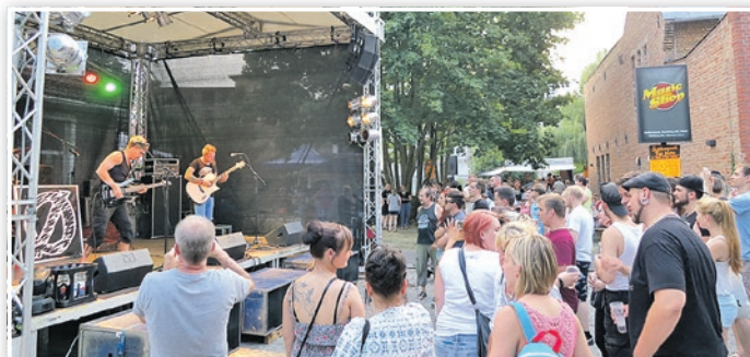
SØNE aus Wünsdorf rockte in den frühen Abendstunden