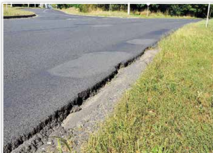
Die Seiten der Fahrbahn sind abgefahren und beschädigt.