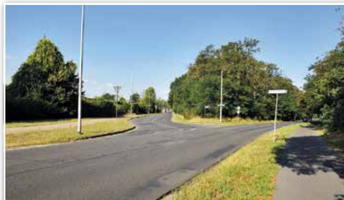
Die bisherige Einmündung am Zapfholzweg: Wer aus Richtung Biotechnologiepark kommt, kann die Fahrzeuge aus Frankenfelder Richtung erst spät sehen. Oft wird hier auch zu schnell gefahren.

Die Kreuzung Frankenfelder Chaussee/Straße des Friedens wurde ebenfalls überdacht.