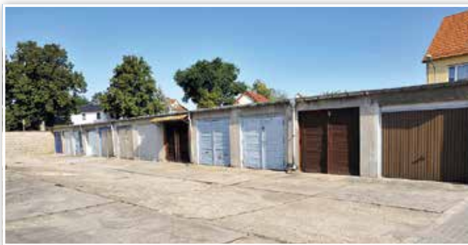
Auch in den Garagenkomplex in der Petrikirchstraße wird investiert.

Insgesamt hat die Stadt Luckenwalde in den fünf Garagenkomplexen in eigener Verwaltung 249 Garagen und Garagenstellflächen. Von den Einnahmen wurden in den vergangenen Jahren zum Beispiel im Garagenkomplex in der Petrikirchstraße die Regenentwässerung