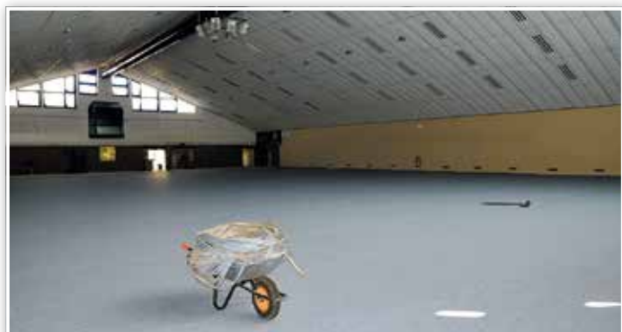
Der moderne, mehrschichtige Bodenbelag bietet perfekte Bedingungen für Sportler.