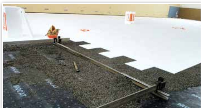
Abdichtung, Ausgleich und Dämmung