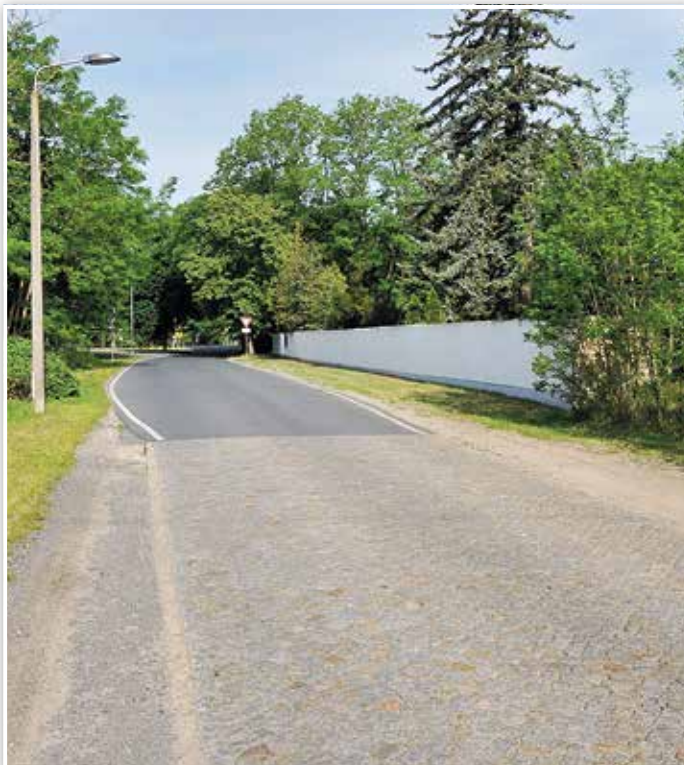
Hier fehlt ein Gehweg. Das sehen viele Kolzenburgerinnen und Kolzenburger so.

Amt Pressearbeit, Verwaltungs- und Kommunalservice