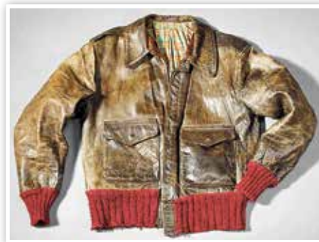
Roman Schmidt Museumsleiter HeimatMuseum Luckenwalde

Nutzen Sie die Gelegenheit und bestaunen Sie die Lederjacke von Rudi Dutschke auf der EinheitsEXPO in Potsdam! EinheitsEXPO Potsdam 2020 zum Tag der Deutschen Einheit: 5. September bis 4. Oktober