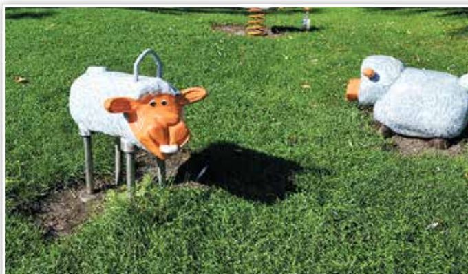
Noch ist die Zunge weiß. Ein kleines Schäfchen kurz vor der letzten Farbschicht.

Die innig geliebten Schäfchen im Nuthepark haben Mitte September eine neue Schicht Farbe bekommen. Die kleinen Spielgeräte stehen zwischen Haag und Rathausparkplatz im Grünen und begeistern besonders die jungen Luckenwalder. Tischler Henrik-Sven Rosenthal hat die Herde dieses Mal nicht abmontiert, sondern den Spätsommer ausgenutzt und die Figuren vor Ort aufgearbeitet. Schadstellen wurden behoben, Kerben verspachtelt und am Ende erhielten