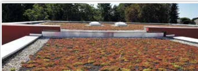
Das Dach des Kitaanbaus ist bereits begrünt.