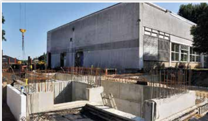
Hier wächst der neue Hort aus dem Boden. Seit der Grundsteinlegung hat sich einiges getan.

Amt Pressearbeit, Verwaltungs- und KommunalService