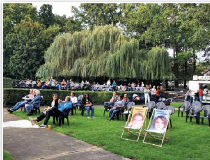
Das Freibad Elsthal bot eine schöne Kulisse und ausreichend Platz.

i. A. Sonja Dirauf Amt Pressearbeit, Verwaltungs- und Kommunalservice