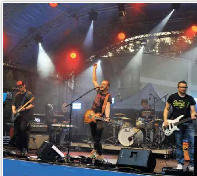
Die Band SchniPoSa hatte viel Spaß auf der Bühne.