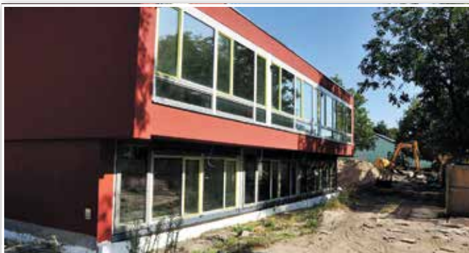
Der Anbau an der Kita Sunshine wurde farblich dem Bestandsgebäude angepasst.