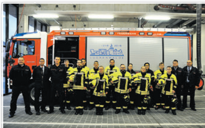
Truppmann/Truppfrauausbildung in der Luckenwalder Feuerwache.

Meine Bitte an alle deutschen Mitbürger: Versetzt euch in unsere Situation und kritisiert uns Zuwanderer nicht so schnell. Nicht jeder ist gleich. Helft uns, euch und eure Kultur kennenzulernen und uns willkommen zu fühlen.