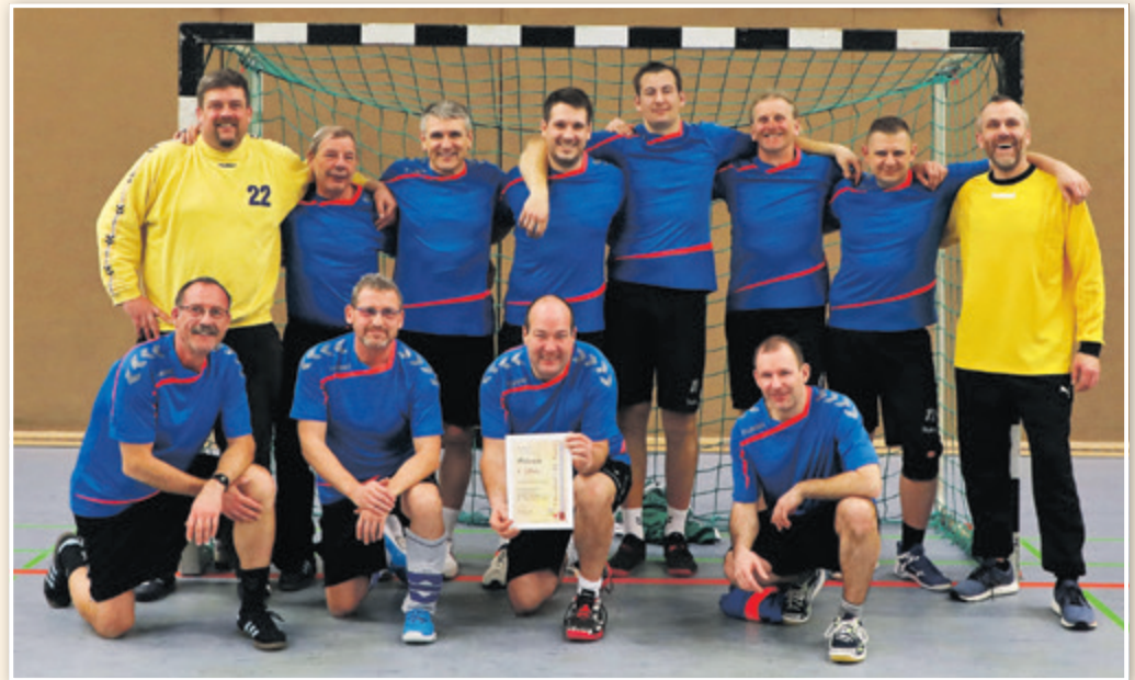
Gastgeber Elektronik Luckenwalde trainiert seit dem letzten Jahr mit gleichgesinnten Sportsfreunden aus Beelitz und Güterfelde und zeigte eine gute Leistung beim Turnier, wenn auch nur der vierte Platz am Ende stand. So spielte man gegen Dahlewitz 7:3; gegen Schöneiche 5:10; gegen Ahrensdorf/Schenkenhorst 3:5; und gegen Rangsdorf 6:8.

Es war wieder schön, ehemalige Weggefährten treffen sich zum Austauschen ihrer Sportart