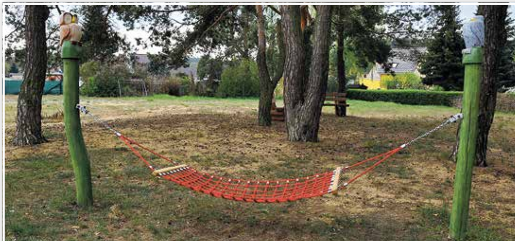
Der Spielplatz im Treuenbrietzener Tor hat in diesem Jahr unter anderem eine neue Hängematte bekommen.