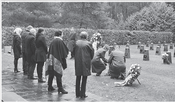
Vertreter von Landkreis, Kreistag, Stadt, Stadtverordnetenversammlung und des Volksbundes Deutscher Kriegsgräberfürsorge gedenken der Opfer von Krieg und Terror.

„Drei Minuten Gehör“ von Kurt Tucholsky vor. Der Dichter hatte nach dem Ersten Weltkrieg damit an alle appelliert, nie wieder einen solchen Krieg zuzulassen. Und doch war es zum „Tiefpunkt der Menschheitsgeschichte“, dem Zweiten Weltkrieg gekommen. „70 Jahre sind seit dem Ende des Zweiten Weltkrieges im Mai 1945 vergangen, 70 Jahre – fast ein ganzes Menschenleben! Sollte man da nicht aufhören, immer wieder an die Gräueltat-