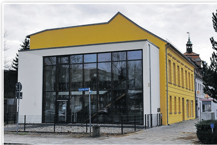
Die „Goldene 33“ erstrahlt in neuem Glanz.

In dieser Aufzählung darf auch das größte Hochbauvorhaben der Stadt nicht fehlen: Zunächst wurde auf dem ehemaligen Gaswerksgelände durch Bodenaustausch in großem Stil eine Gefahr für das Grundwasser beseitigt. Seit April entsteht dort die neue Feuerwache. Überzeugen Sie sich im Dezember 2016 davon, dass dieser Neubau in würdiger Tradition der reichen Architekturgeschichte unserer Stadt steht.