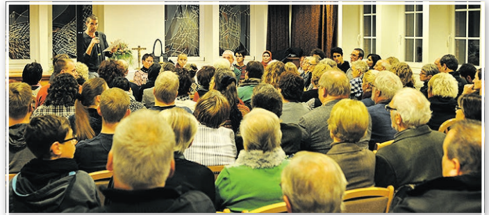
Bei der ersten Informationsveranstaltung „Flüchten nach Luckenwalde – Zuflucht in Luckenwalde“ gab es reges Interesse.

Ob sich diese Erfahrung auf die heutige Situation übertragen lässt, muss sich noch erweisen. Wie viele Flüchtlinge werden in Luckenwalde bleiben wollen, nachdem ihnen ein Aufenthaltsrecht in der Bundesrepublik zuerkannt worden ist? Gelingt die Integration in den Arbeitsmarkt und in die Stadtgesellschaft? Wenn Heimat durch Verbundenheit, durch Anteilnahme und Mitwirkung entsteht und nicht durch Abgrenzung, dann wird es von entscheidender Bedeutung sein, wie sehr sich Alteingesessene und Neubürger aufeinander zubewegen können und wollen.