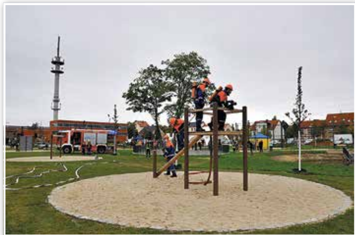
Jugendfeuerwehr in Aktion

Je schöner das Umfeld wurde, umso störender wirkte dann die Restfläche. Aber auch dieser Eindruck ist heute Vergangenheit. Denn die Restfläche verwandelte sich in 100 weitere benötigte Pendlerparkplätze und in Kundenparkplätze zugunsten der Geschäfte an der Brandenburger Straße. Die Parkanlage der anderen Art trägt dem Gedanken der Bienenfreundlichkeit Rechnung. Die Grünfläche erweist der Jugendfeuerwehr mit einer Übungsstrecke ihre Reverenz und sie erfüllt einen Bürgerhaushaltswunsch, indem ein Calis-