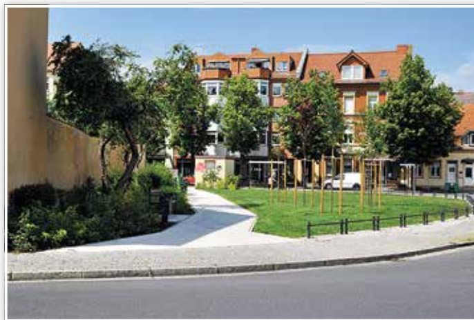
Die Grünanlage Zinnaer Straße Ecke Rudolf-Breitscheid-Straße in neuem Glanz.

Gerade in der Coronazeit, die durch den Verzicht auf Urlaubsreisen, durch Homeoffice und die wiederholten Appelle, zuhause zu bleiben, gekennzeichnet ist, kommen die zusätzlich geschaffenen Möglichkeiten für Aufenthalte unter freiem Himmel wie gerufen. Auch der mit Bordmitteln und in Eigenleistung aufgewertete kleine Dreiecksplatz an der Zinnaer Straße gehört deshalb in die Aufzählung unserer grüner gewordenen Stadt.