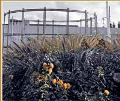
Umgestaltung des ehemaligen Gaswerksgeländes