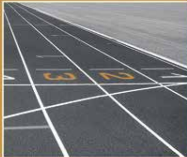
Neue Kunststofflaufbahn im Werner-Seelenbinder-Stadion