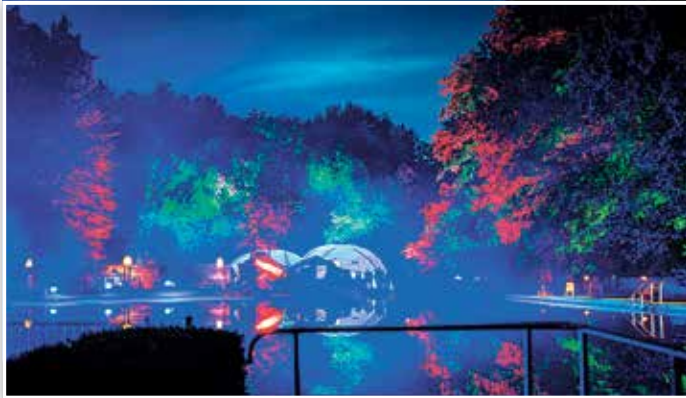
Das Freibad Elsthal einmal in einem anderen Licht beim Himmelweit-Festival.