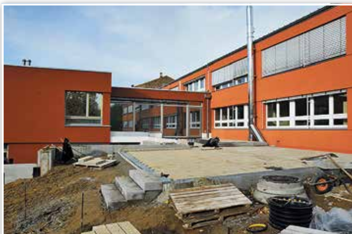
Die Kita Sunshine bekommt außer einem Anbau auch neugestaltete Außenanlagen.

So wurde unsere Strategie zur Schaffung einer bedarfsgerechten und zeitgemäßen Bildungslandschaft konsequent weiter verfolgt und kann sichtbare Resultate aufweisen: Seit September letzten Jahres wird auf der Baustelle Kita-Sunshine gebaggert, gestemmt und gemauert, um das Bestandsgebäude lichtdurchflutet und großzügig werden zu lassen. Und in einem Anbau werden u. a. ein großer Mehrzweckraum für alle und im Gartengeschoss drei zusätzliche Gruppenräume für Krippenkinder geschaffen. 1,8 Millionen Euro stellt die Stadtverordnetenversammlung für die Baumaßnahme bereit, zu zwei Dritteln finanziert aus dem Städtebauprogramm. Es muss erwähnt werden, dass die Bauarbeiten bei laufendem Betrieb vorstattengehen. Wir schulden dem Erzieherteam jeden Respekt, dem es gelingt, trotz dieser Beeinträchtigungen und trotz der durch Corona bedingten Belastungen eine gute Kinderbetreuung aufrecht zu erhalten. Mit dem Ende der Bauarbeiten im nächsten Jahr und der Inbesitznahme der dann nicht wieder zu erkennenden Kita wird sich hoffentlich der Eindruck durchsetzen, dass sich alle Mühen gelohnt haben.