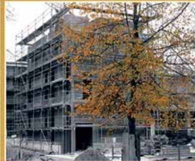
Hortneubau auf dem Gelände Schulzentrum Ludwig-Jahn-Straße