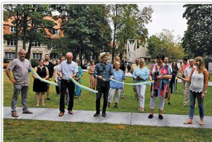
Eröffnung des neugestalteten Bürgerparks am Ehrenhain

Die ehemalige Aufmarschfläche wurde entsiegelt und der vorhandene Baumbestand gelungen aufgewertet. Sitzstufen, Bänke und Wiese warten darauf, als grünes Klassenzimmer und Naherholungsraum in Besitz genommen zu werden. Die Mitglieder der AG Ehrenhain setzten sich mit ihrem Vorschlag durch, sozusagen als Tüpfelchen auf dem „i“, Fitnessgeräte zu platzieren, die insbesondere auch auf die Fähigkeiten älterer Menschen ausgerichtet sind. Mit sehr viel Sorgfalt wurden dann drei Geräte ausgewählt, die das Angebot unterstreichen, alle Generationen einzuladen. Es ist schön, festzustellen, dass diese Einladung nun täglich angenommen wird.