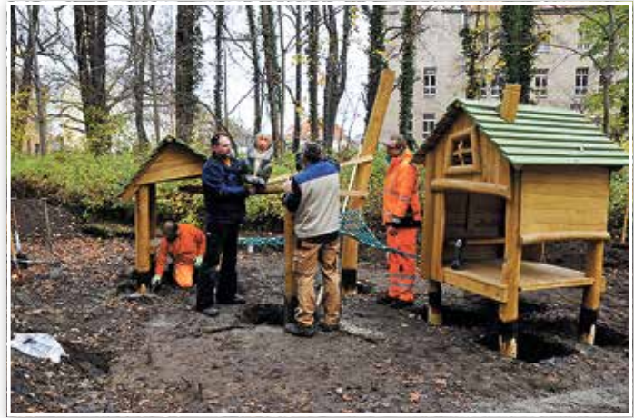
Aufbau des neuen Tierpark-Spielplatzes.

Diese Attraktion wird noch mehr Laune machen, zum Stammgast der beliebten Einrichtung zu werden – sobald es die Corona-Regeln erlauben.