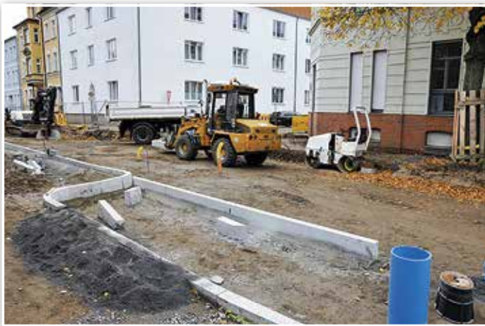
Der letzte Bauabschnitt der Dahmer Straße.

In der Dahmer Straße wird die Geduld der Anlieger nach drei Jahren Bauzeit zum Ende des Jahres mit der Fertigstellung der Straße belohnt. Der dort betriebene Leitungsbauaufwand hatte es aber auch in sich: Trinkwasserhauptleitung, Fernwärmeleitungen, Gasleitung, Abwasserkanal, Regenwasserkanal, Strom, Beleuchtungskabel und Schutz- und Leerrohre als Vorbereitung des Breitbandausbaus einschließlich der dazu gehörenden Hausanschlüsse. Herausfordernd auch die Aufgabe, den Straßenbau unter Erhalt und Schutz von zwei Dritteln des Altbaumbestands durchführen zu müssen. Im kommenden Jahr soll das gesamte Karree als Zone 30 ausgewiesen werden und so dem Wohngebietscharakter in besonderer Weise Rechnung tragen.