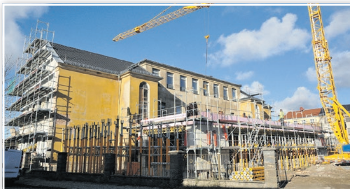
Der Altbau wird saniert und im Hof ein Neubau ergänzt – Baustelle in der Kurzen Straße.

nen, der klimaschonend und nachhaltig ist. Das gesamte dreistöckige Gebäude ist eine Holzkonstruktion, die gute Dämmwerte vorweist. Viele Teile wurden in einem Abbundwerk vorgefertigt und zur Montage auf die Baustelle geliefert. Das ersparte etlichen Baulärm an Ort und Stelle. Nun wird auch noch der gesamte Außenbereich rund um die Mensa aufgewertet und kommt allen Schülern zugute. Im Kitabereich hat der Verein Menschenskindern Luckenwalde e. V. zur weiteren Trägervielfalt und zu mehr Betreuungsplätzen beigetragen. Im März 2021 konnte er in der Grabenstraße für die erste Elterninitiativ-Kita in Luckenwalde, die für 25 Kinder ausgelegt ist, die Tore öffnen. Es nötigt Respekt ab, dass die Vorbereitungen, angefangen von der Suche nach einem geeigneten Objekt, seiner baulichen Ausgestaltung und Einrichtung bis hin zur Betriebserlaubnis und dem gesamten Kita-Management durch den ehrenamtlich arbeitenden Vereinsvorstand und die Elternschaft geleistet wurden und werden.