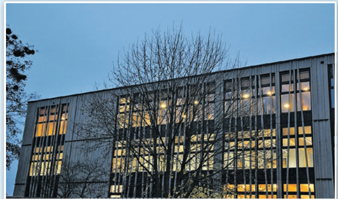
Neuer Hort in Holzbauweise

sind Sie auch müted ? Dieser neue Begriff hat noch keinen Eingang in den Duden gefunden. Die Mischung aus müde und wütend beschreibt meine Gemütslage ganz anschaulich. Zum einen sind bei mir nach 21 Monaten müde und müde machender Corona-Pandemie die Gelassenheitsreserven nahezu aufgebraucht. Die bange Frage, wann diese bleierne Zeit endlich enden wird, ist angereichert mit großem Unverständnis, um nicht zu sagen Wut. Denn diese vierte Welle, in der wir stecken, ist die erste, die hätte vermieden werden können, wenn sich mehr Menschen an dem mittlerweile ausreichend vorhandenen und jedermann zugänglichem Impfstoff bedient hätten. Im Land Brandenburg sind gerade mal 61,9 % vollständig geimpft (Da-