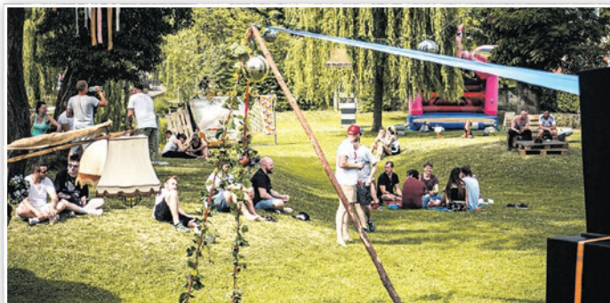
Der Nuthepark verwandelte sich im Juni in ein Festivalgelände mit origineller Dekoration.

ckelschafen. Abends genossen es die Besucher, unter den mit Disco-Kugeln und Lampenschirmen geschmückten Bäumen den Darbietungen regionaler DJs zu lauschen und zu tanzen. Luckenwalder Gastronomen sorgten für die Versorgung.