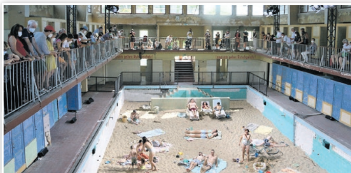
Ein Schwimmbecken voll Sand im alten Stadtbad – nicht nur die ungewöhnliche Theaterkulisse zog zahlreiche Besucher zu Sun & Sea.