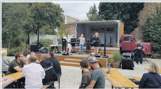
Nachwuchskünstler auf der Volksbühne