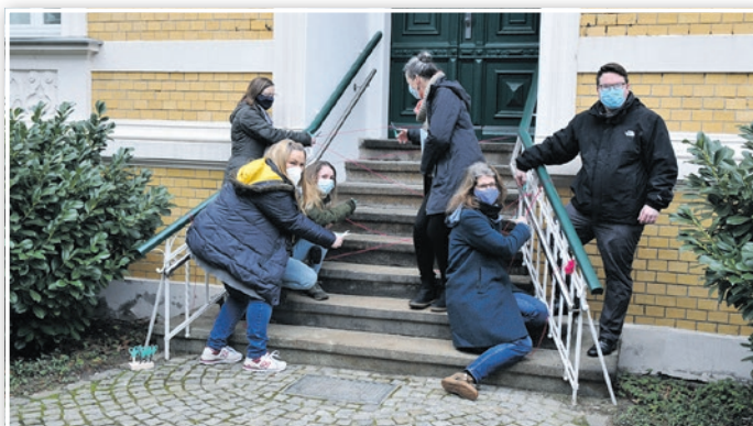
Alle Beteiligten ziehen an einem Strang – Eröffnung der Kita Menschenskindern in der Grabenstraße.

Unter diesem Motto steht der Neubau eines Hortes auf dem Schulgelände Ludwig-Jahn-Straße, der dem zunehmenden Platzbedarf Rechnung trägt. 240 Grundschulkindern finden dort im neuen Jahr beste Bedingungen vor: Ruhige oder bewegungsintensive Nutzungsbereiche ersetzen die aus der Schule bekannten Flur-Raum-Lösungen und ermöglichen Spielen und Toben, aber auch konzentriertes Arbeiten bis hin zu Darstellen, Gestalten und Musik machen. Unser Stadtmotto lautet: „Luckenwalde – Werkstadt der Moderne – Labor der Zukunft“. Die so ausgedrückte Experimentierfreude kommt auch beim Hortneubau zum Zuge. Es ist nicht paradox, sich bei der Gestaltung der Zukunft auf einen alten Baustoff wie Holz zu besinnen,