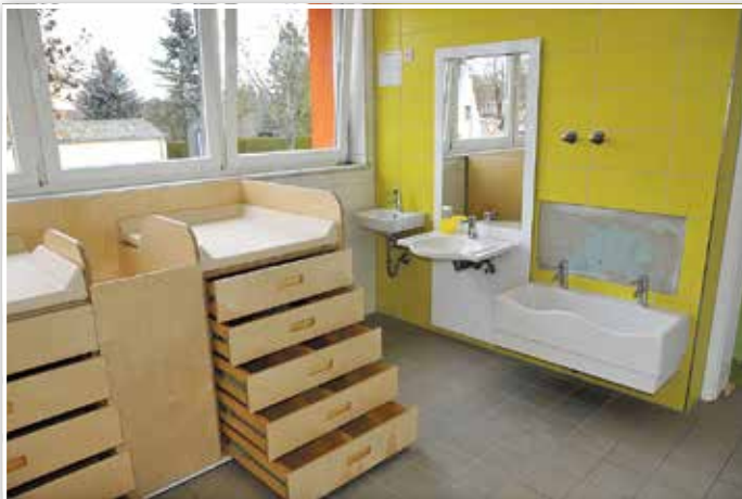
Ein neusaniertes Bad im Bestandsgebäude der Integrationskita Sunshine mit höhenverstellbarem Waschbecken.

In Luckenwalde werden bis einschließlich 2022 die Kita Sunshine, die Kita Vier Jahreszeiten und die Kita Burg unterstützt.