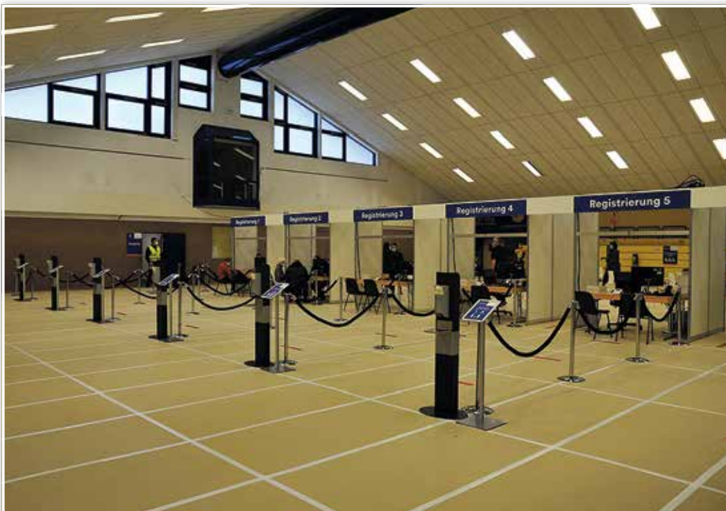
Die Ersten, die eine Impfung erhalten, bei der Registrierung. Ohne Termin hat man jedoch keine Chance auf eine Impfung.

i. A. Sonja Dirauf Amt Pressearbeit, Verwaltungs- und KommunalService