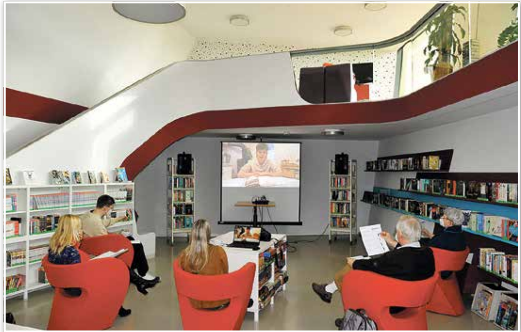
Geschichten per Leinwand – aufmerksame Stille im Raum herrschte trotzdem.

Trotz des ungewöhnlichen Formats schafften es die ausge-