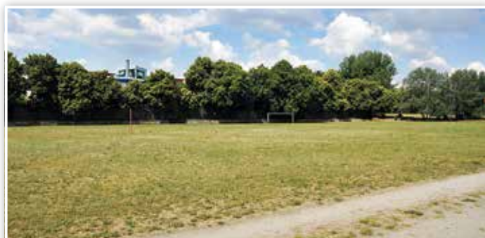
Ob man hier auf dem Mozartplatz bald Bahnen schwimmen kann?

Mit nur vier Stimmen weniger landete dieser Vorschlag auf Platz sieben. Die zentrale Frage, die sich jedoch dazu stellt ist: Was ist nötig und auf Dauer wirtschaftlich tragbar ohne bereits Geschaffenes zu gefährden? Um dies abzuwägen, wird zunächst ermittelt, wie viel Pro-Kopf-Wasserfläche je Einwohner das Luckenwalder Freibad und die Fläming-Halle bereits bieten. Der Vergleich mit Zahlen in Land und Bund wird zeigen, ob eine weitere Bademöglichkeit für eine Stadt unserer Größe überzogen sein könnte. Schon jetzt werden große Summen benötigt, um das Freibad Stück für Stück zu sanieren und die Fläming-Therme zu erhalten und im Wettbewerb mit anderen Bädern attraktiv zu gestalten. Geplant sind zum Beispiel die Sanierung des Whirlpoolbereichs und der Bau eines Außenschwimbeckens.