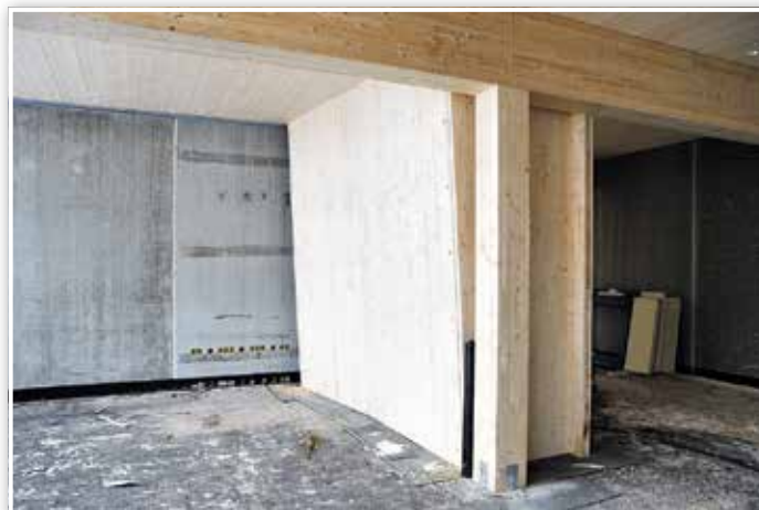
Diese krumme Wand ist kein Baumangel. Hier wird eine Kletterwand entstehen.