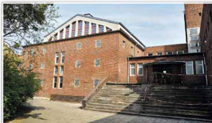
Viele Luckenwalder kennen das Potenzial des Stadtbades und möchten es nicht länger leerstehend wissen.

bekundet am Forschungsprojekt „Zukunft im Bestand – Entwicklungsperspektiven für historische Schlüsselgebäude“ des Bundesinstituts für Bau-, Stadt- und Raumforschung. Das Luckenwalder Stadtbad wurde als eines von sechs Modellvorhaben bundesweit ausgewählt. Derzeit wird eine Machbarkeitsstudie zur Umnutzung des Stadtbades für die Kreativwirtschaft erstellt. Die Leerstandskonferenz 2018 war dazu der ideengebende Hintergrund ebenso wie das Zentrum für Kunststrom und zeitgenössische Kunst im E-Werk nebenan.