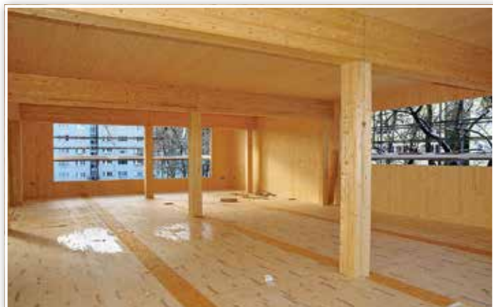
In alle Aussparungen in den Außenwänden werden später große Fenster eingebaut. Gelüftet wird über Oberlichter, so dass die fast bodentiefen Fenster keine Gefahr darstellen.

Amt Pressearbeit, Verwaltungs- und KommunalService