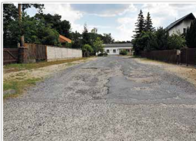
In der Bergsiedlung sind viele Straßen Flickwerk. Das stört auch die Anwohner im Buchenweg.

Für diesen Vorschlag kamen 264 Stimmen zusammen. Auch hier verwies die Bürgermeisterin auf die anstehende Fortschreibung des Straßenausbauprogramms. Zuvor soll ein Konzept zur Sanierung der Bergsiedlungsstraßen erstellt werden, das den jeweils vorgeschlagenen Ausbaustandard erfasst.