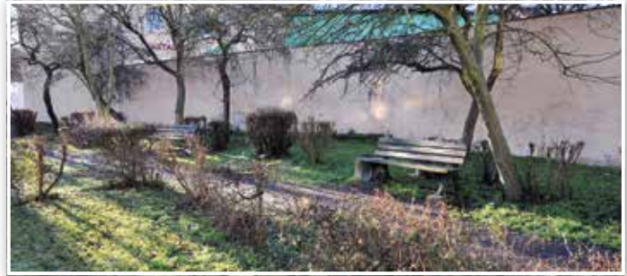
Noch vor wenigen Wochen an derselben Stelle: Unbefestigte Wege und kaputte Bänke.