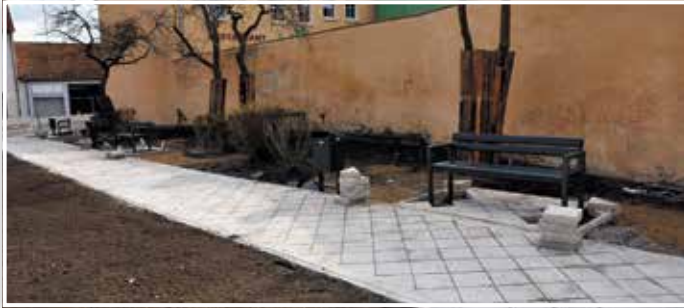
Barrierefreies Pflaster, seniorenrechtliche Bänke – die Grünanlage Anfang März.