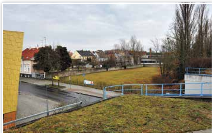
Hier in der Käthe-Kollwitz-Straße, vor der Bahnunterführung, wird ein neuer Parkplatz entstehen.

plätze, wovon fünf Kurzzeitplätze sein werden, wird Ende Mai begonnen. Der Radweg entlang der L 73 wird innerorts 2.073.300 Euro kosten. Neben verschiedenen Fördermitteln beträgt der Eigenanteil der Stadt 266.700 Euro. Weitere Projekte zur Förderung des Radverkehrs sind die geplanten Fahrradabstellboxen am Bahnhof sowie ein dezentrales Fahrradparkhaus an drei Standorten.