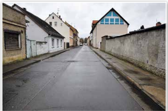
Die Buchtstraße wartet schon lange auf eine Sanierung.

Gemeinsam mit der Nuwab sind Planung und Ausbau der Buchtstraße vorgesehen. Die Kosten werden auf 263.400 Euro geschätzt. Der Gehweg in der Jänickendorfer Straße soll in diesem Jahr im Abschnitt zwischen Dammstraße und Rosa-Luxemburg-Straße saniert werden. Dies wird 199.000 Euro kosten. Weitere 107.000 Euro sind für den Gehweg in der Brandenburger Straße zwischen Fontane- und Pestalozzistraße vorgesehen. Entsprechend des 4. Bürgerhaushalts wird für den Ortseingang in Kolzenburg ein Gehweg geplant, was 15.000 Euro kosten wird. Weitere Pläne sollen für die Sanierung der Anhaltstraße, der Frankenfelder Chaussee und des Meisterwegs erstellt werden. Zum Teil können hier Fördermittel beantragt werden.