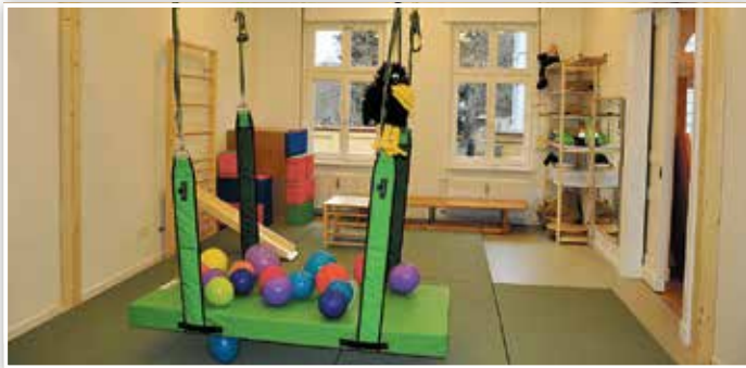
Der Mehrzweckraum lädt zum Toben und Klettern ein.