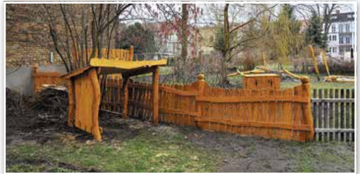
Auch Bewegung an der frischen Luft ist möglich.