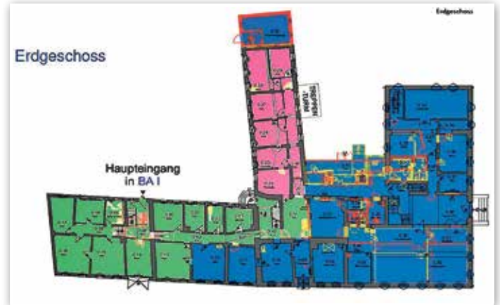
In blau der erste Bauabschnitt, in grün der zweite, in rosa der dritte.

Am 5. Mai ist der offizielle Baustart für die Sanierung des Luckenwalder Rathauses. Das denkmalgeschützte Gebäude, das aus mehreren Anbauten aus unterschiedlichen Epochen besteht, soll funktionaler, barrierefrei und für Bürger übersichtlicher werden.