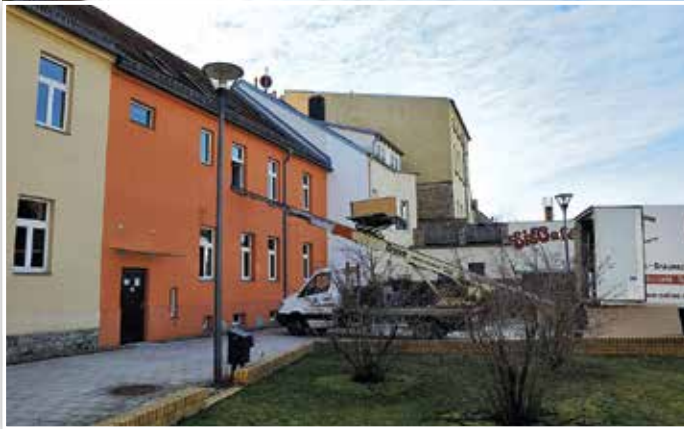
Im März zogen mehrere Ämter aus dem Rathaus aus. An etwa dieser Stelle wird später der Infopoint stehen. .