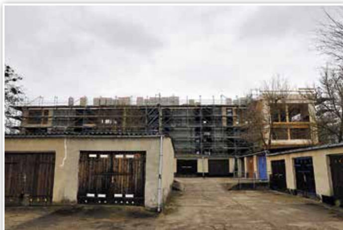
Der neue Hort auf dem Gelände der Ludwig-Jahn-Schule aus Richtung der Garagenanlage.

Amt Pressearbeit, Verwaltungs- und Kommunalservice