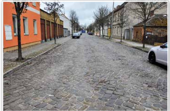
Sprurrillen, tiefe Löcher im großen Pflaster und Überschwemmungen bei Regen, so kennt man die Dessauer Straße derzeit.

Die Fallrohre der Dachrinnen erhalten einen direkten Anschluss an den Regenwasserkanal. Dort, wo die Möglichkeit besteht, kann das Regenwasser auf der Hoffläche versickert werden. Die vorhandenen Bäume (Wildbirne) werden bis auf die abgängigen Exemplare in die Neugestaltung der Gehwege einbezogen. Vor der Straßenbaumaßnahme werden die Bäume durch einen