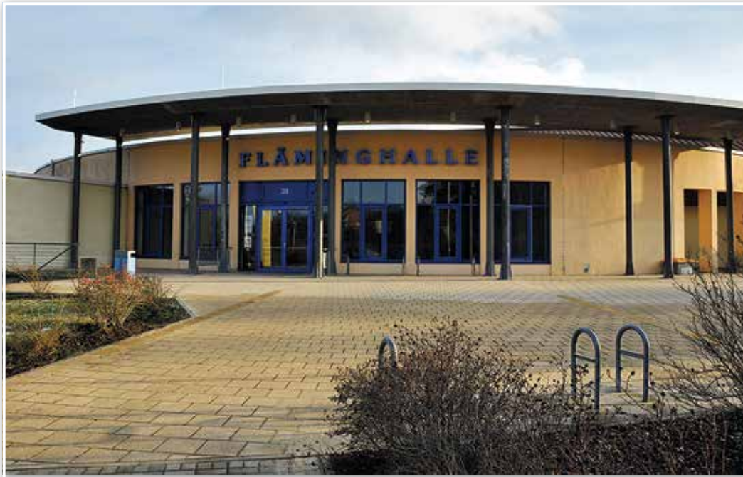
Das Luckenwalder Impfzentrum ist in der Fläminghalle, Weinberge 39. Doch eine Impfung bekommt nur, wer einen Termin hat.

Selber Termine vergeben kann die Stadt Luckenwalde nicht. Sie bietet ausschließlich den über 80-Jährigen an, die zum Teil zeitraubende Terminvereinbarung zu übernehmen. Außerdem informiert sie über das mediMobil, das zu Impfende in Luckenwalde für eine Pauschale von 15 Euro zum Impfzentrum in der