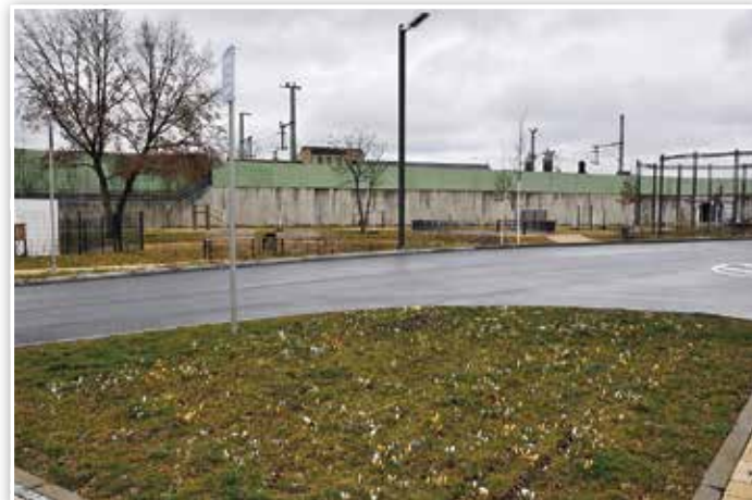
Auch auf der Calisthenicsanlage auf dem ehemaligen Gaswerksgelände gilt nun Maskenpflicht.

Einen kostenlosen Corona-Schnelltest für Menschen ohne Symptome gibt es in Luckenwalde bei der Spitzweg-Apotheke, Fontanestraße 16 b, der Burgwall-Apotheke,