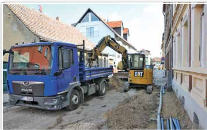
Der zweite Bauabschnitt bietet den Bauarbeitern wieder wenig Platz.