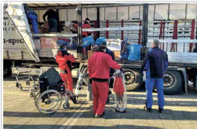
Am Luckenwalder Gewerbehof werden Sachspenden aufgeladen.

Die Stadt Luckenwalde bedankt sich von Herzen bei allen Bürgerinnen und Bürgern für die zahlreichen Sachspenden. Ein be-