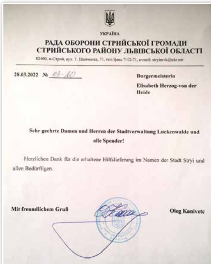
Sowie ein Dankeschön der Stadt Stryi