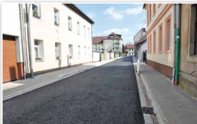
Der frisch sanierte erste Bauabschnitt

Amt Pressearbeit, Verwaltungs- und Kommunalservice