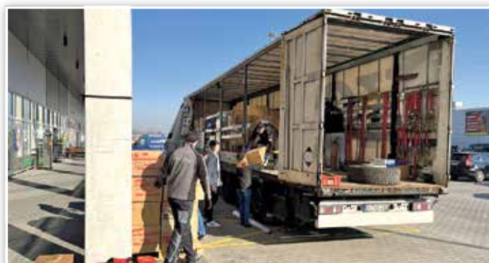
Aus Polen erreichte uns dieses Bild vom Abladen der Spenden aus Luckenwalde.