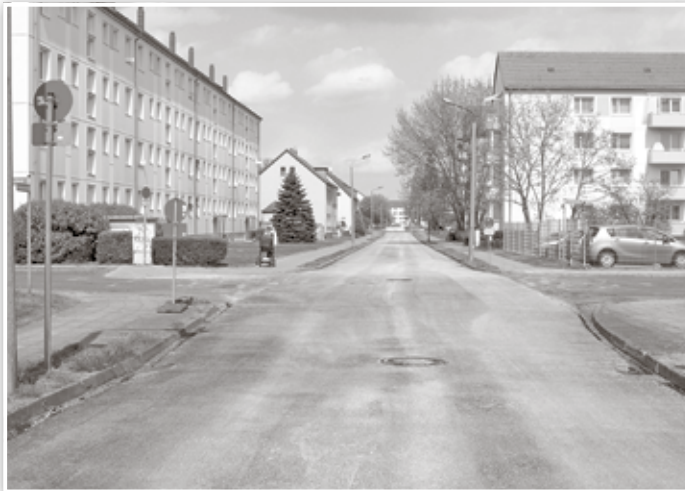
Frisch asphaltierte Fontanestraße

i. A. Britta Jähner Amt Pressearbeit, Verwaltungs- und Kommunalservice