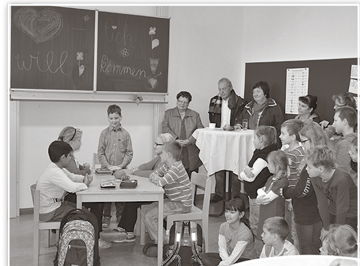
Zur Eröffnung der Einrichtung führten Kinder ein kurzes Theaterstück auf. Außerdem gab es musikalische und tänzerische Darbietungen.

i. A. Sonja Dirauf Amt Pressearbeit, Verwaltungs- und Kommunalservice