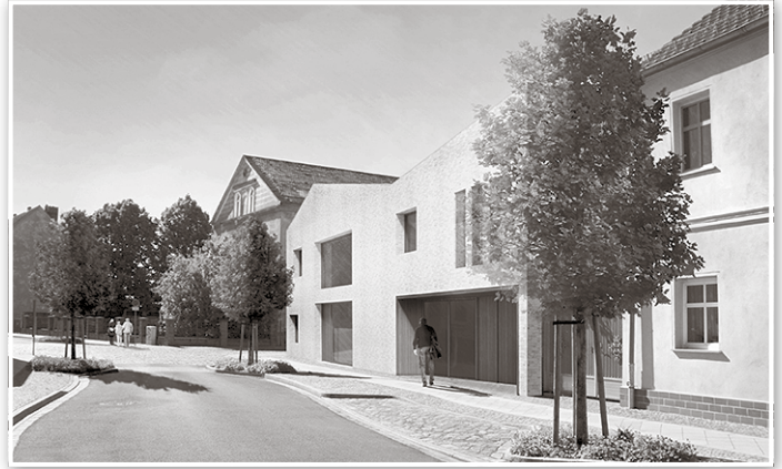
So soll es in der Kurzen Straße 4 einmal aussehen. Besonders gelobt wurde der Umgang mit dem Tageslicht.

Prof. Heinz Nagler, der das Preisgericht leitete, betonte die viele Arbeit, die in allen Entwürfen steckt. Man habe sich einer großen Herausforderung gestellt, die viel Taktgefühl erfordere. Eine solche Einrichtung in würdigem Rahmen zu planen, diese in ein normales Wohnquartier zu integrieren und gleichzeitig die Luckenwalder Baukultur fortzuführen, sei keine alltägliche Auf-